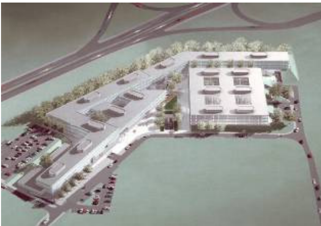
Atrium Business Park à Bourmicht/Luxembourg 124 000 m 2 Atelier d'Architecture Paczowski et Fritsch