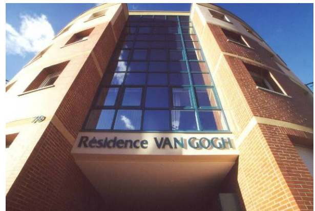
Résidence Van Gogh à St Avold (F) Espace Architecture