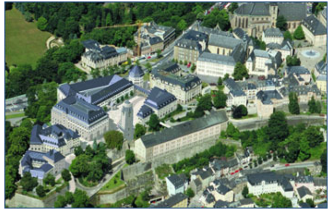
Cité Judiciaire à Luxembourg 40 000 m 2 Architecte Robert et Léon Krier / Architecture & Environnement