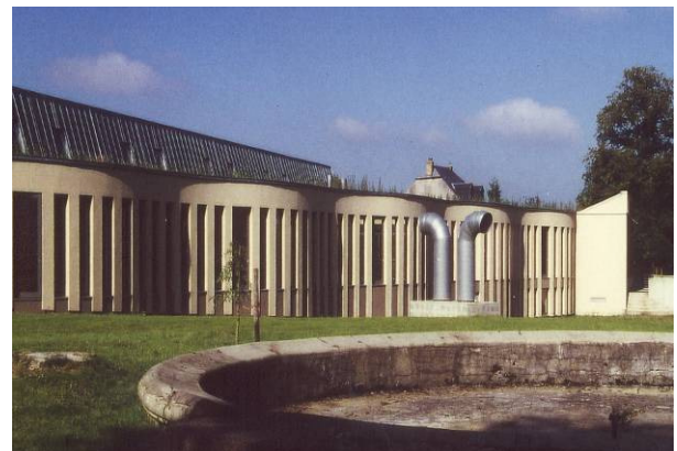
Ateliers de rééducation fonctionnelle IMC Kraizbiert, 6.000 m 2 Bureau d'architecture HERA