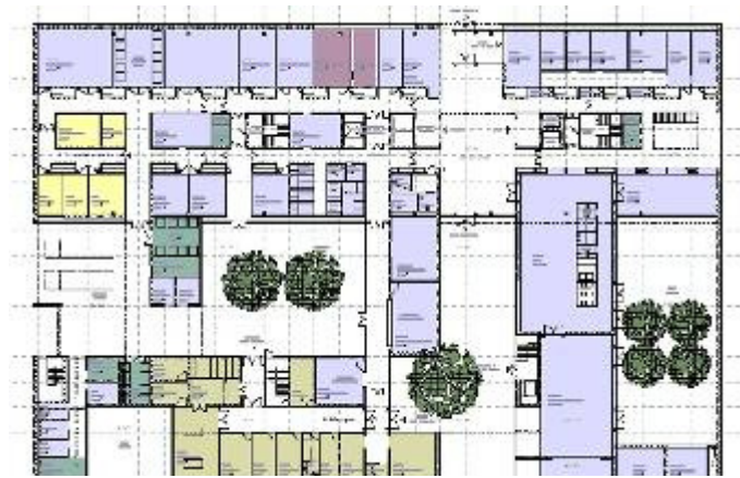
Laboratoire National de Santé à Dudelange (L) 23 000 m 2 Architectes Van den Valentyn / Petit