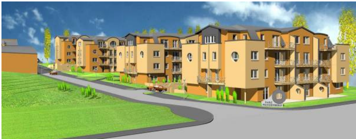
Parc Résidentiel Prinzenberg à Differdange (L) 13 800 m 2 BK Architectes