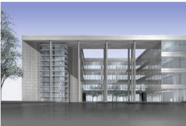
Immeuble administratif Laccolith à la Cloche d'or à Luxembourg 21.074 m 2 , 63.000m 3 Atelier d'Architecture Paczowski et Fritsch